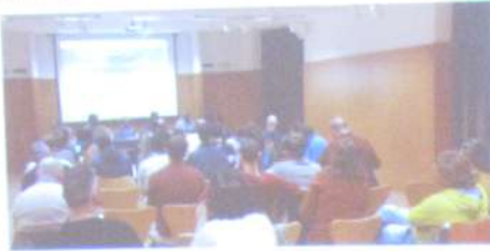
Presentació de l'última sessió del cicle de seminaris.