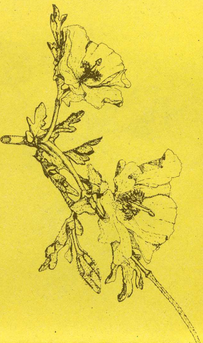
Glaucium flavum Cascall marí Rosella marina

Algunes espècies de plantes que podem trobar a les nostres platges